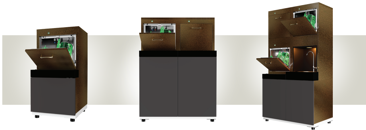
ONE Chamber 원챔버 세척기로 협소한 공간에 알맞은 미니멀한 사이즈의 텀블러 세척기